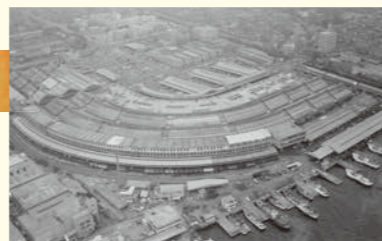
1964年當時的築地市場

1935年開設了築地、神田、江東3個市場，隨後豐島、淀橋、足立、肉類等市場投入運營。此後，為了滿足城市人口增加等的需求，依次開設了板橋、世田谷、北足立、多摩新村、葛西等各個市場。