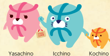
Yasachino Icchino Kochino