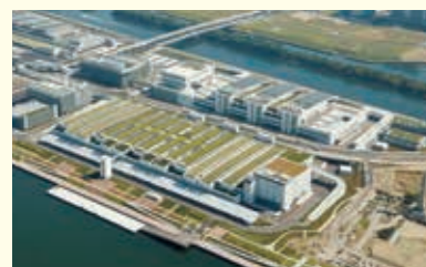
2018年投入運營的豐洲市場

1988年以後，在北足立市場等5個市場新開設了花木部。 1989年，大田市場投入運營，成為11個市場。 此後於2018年，作為首都圈新的主要市場，豐洲市場投入運營。