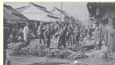
明治時代的神田蔬菜市場（蔬果市場）