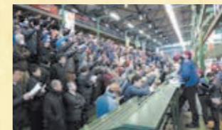
人工競拍（水產品、蔬果）

在批發場地開始競拍。在拍賣人（批發商）的主持下，競拍人（經紀批發商及參加買賣者）出價，商品向出價最高者出售。