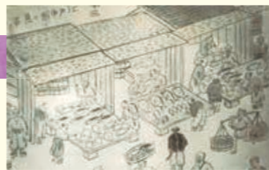
江戶時代中期的鮮魚市場