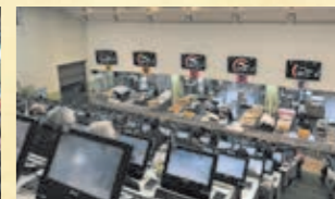
機器競拍（花木、肉類）

除了採用競拍交易外，還有批發商與買方（經紀批發商及參加買賣者）等以1對1方式直接交涉價格及數量的「雙邊交易」等。