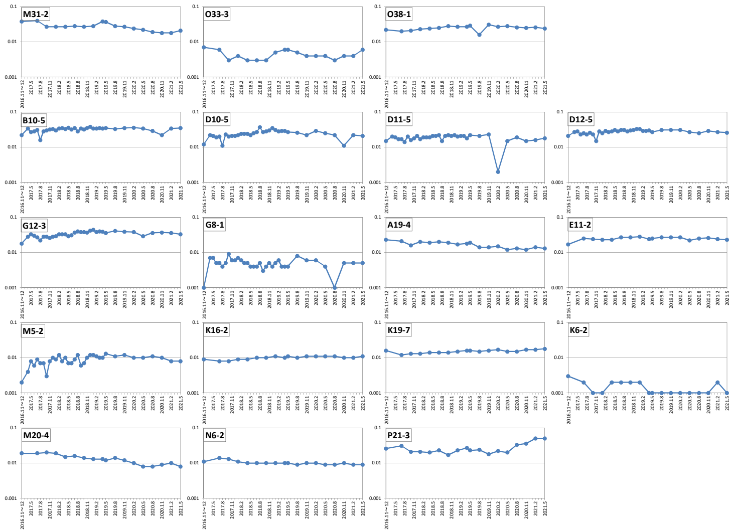
※グラフの縦軸は濃度(mg/L)を表している ※不検出(0.001mg/L未満)は0.001mg/Lとしてプロットしている