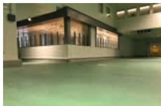
金槍魚拍賣參觀台

這裡是日本國內外水產品彙集並交易的地方。從這裡的參觀者專用參觀台可近距離觀看金槍魚拍賣。