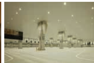
果蔬批發賣場（從參觀台可以看到）